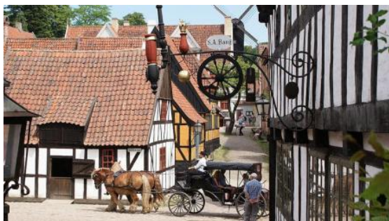
Den Gamle By, gdzie z oryginalnych zabytkowych struktur z całej Danii odtworzono zabudowania, warsztaty rzemieślnicze, rezydencje, teatr, pocztę,

z czerwonej cegły w Jutlandii. Jego budowa rozpoczęła się w roku 1190. We wnętrzu świątyni znajduje się ponad 200 fresków z XIV i XV wieku, a także 16-to wieczny ołtarz dłuta mistrza Bernta Notke z Lubeki. Po wycieciu w katedrze czas wolny w centrum miasta. Przed powrotem na molo zatrzymamy się w jednej z największych atrakcji turystycznych Danii - skansenie miejskim